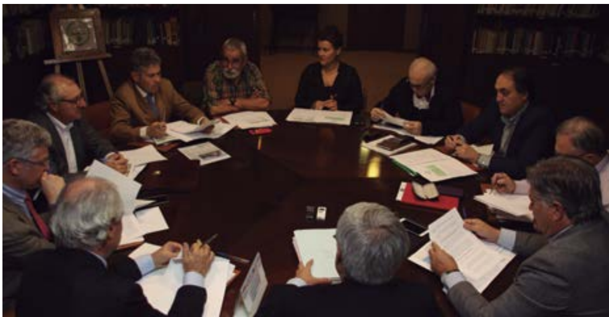
Pleno de la Junta Permanente.

El Consejo General de Colegios Veterinarios inició el 14 de noviembre una campaña de difusión profesional dirigida al conjunto de la sociedad a través de la radio y la televisión con un mensaje central: la salud y el bienestar animal son las razones de ser de la Veterinaria.