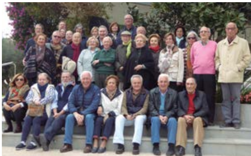
Foto de familia de los compañeros que disfrutaron el pasado mes de marzo de la estancia en San Juan, Alicante.

Algunos Colegios se han sumado a esta iniciativa de la Asociación Nacional y han invitado, según sus posibilidades, a compañeros jubilados. A fecha de hoy, entre los invitados por sus respectivos Colegios y aquellos que el sorteo de la asociación sonría, se prevé la asistencia de 70, que con