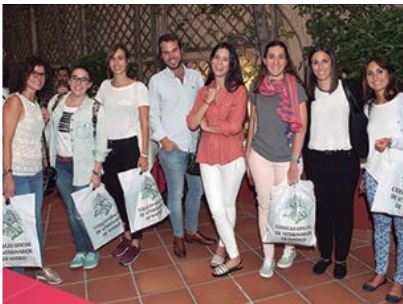
Algunos de los alumnos de la XIII edición del MSA XIII posan sonrientes tras finalizar el evento.

// Más del 70 por ciento de los alumnos de ediciones anteriores han podido incorporarse al mercado laboral.