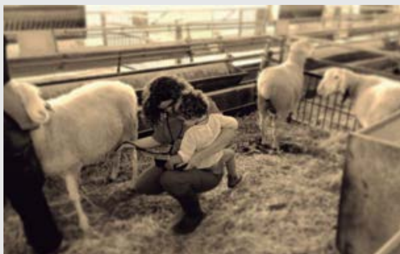
"Conciliación", de Maite Olaciregui, se alzó con el primer premio del sexto concurso de fotografía organizado por el Colegio de Huesca. "Buscando varroa", de Antonio Vigo resultó segunda clasificada. Las bases del concurso, que genéricamente respondió al título de "El veterinario en la sociedad actual", establecían la importancia de plasmar en las instantáneas el trabajo profesional realizado por los veterinarios en cualquiera de sus aspectos.

Se precisará de un certificado electrónico de firma digital que acredite la identidad del usuario así como la validez y legalidad de la receta. Este certificado vincula al veterinario y a un número de registro de ámbito nacional.