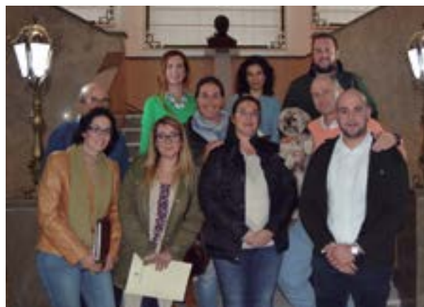
Miembros de la Comisión de Bienestar Animal.

Del mismo modo, se va a solicitar a la Administración que cree una normativa específica para el control de las colonias de gatos urbanos en los pueblos y ciudades de