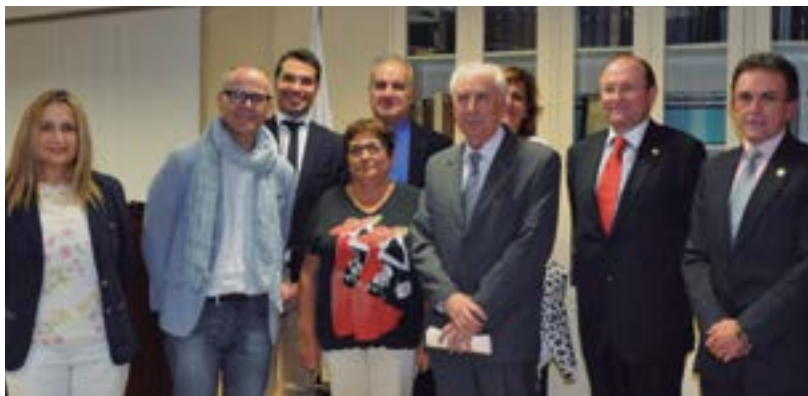
El presidente del Colegio (segundo por la derecha) posa con miembros de la Junta de Gobierno y algunos de los homenajeados.