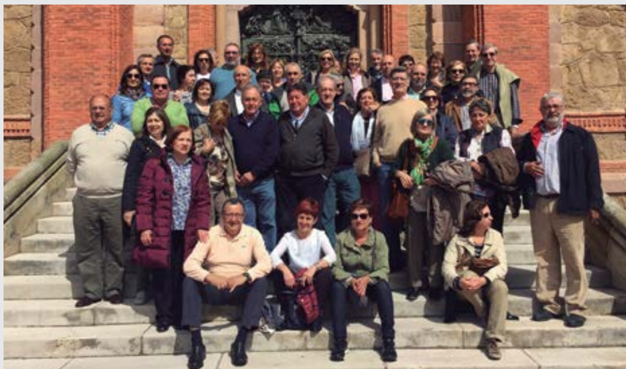
Cantabria recibió a la XXXI promoción de la UCM. - La XXXI promoción de Veterinaria de la Universidad Complutense de Madrid celebró su cuadragésimo aniversario por tierras cántabras. Unos cincuenta compañeros visitaron la ciudad de Santander, donde fueron recibidos en el Ayuntamiento por una representación de la corporación municipal, y embarcaron posteriormente en un catamarán para disfrutar de la bahía que envuelve la ciudad. La tradicional visita cultural que esta promoción realiza en sus sucesivos aniversarios les condujo a Comillas (la fotografía está tomada en el pórtico de la Universidad), Santillana del Mar y las cuevas de Altamira. Esta promoción celebró su 20 aniversario en Toledo, el 25 en Madrid y el 30 en Ávila. Artículo de José María Arroyo en la web del Consejo General: http://www.colvet.es/node/2151

Todo aquel que tenga interés en realizar el curso puede mandar su currículum vitae a la dirección secretariaespa@gmail.com. Por las características del curso se prioriza estar en posesión del título de licenciado o grado en Veterinaria sobre otras disciplinas, lo que justifica también que las plazas sean limitadas. Se impartirá de nuevo en la Facultad de Veterinaria de la Universidad Complutense de Madrid con una estructura y un horario presencial similar al anterior.