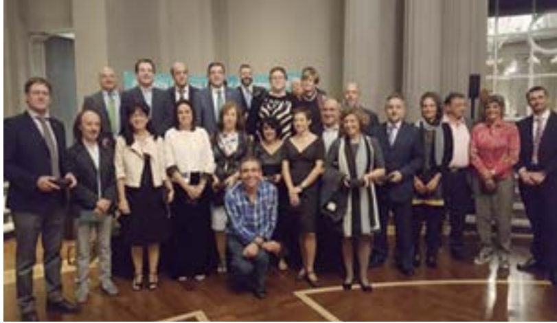
Compañeros homenajeados por sus 25 años de colegiación en el ICOVZ

A lrededor de doscientas personas participaron en los actos conmemorativos de la festividad de san Francisco de Asís. Los actos dieron comienzo el día 4 de octubre con la celebración de una misa. En la homilía el oficiante recordó el amor que Francisco tenía por los animales y su forma de vida sencilla y humilde, aun proviniedo de las clases más pudientes de la Asís de la época. Al término del oficio, los colegiados presentes tomaron un vino español en las instalaciones del Colegio de veterinarios de Zaragoza.