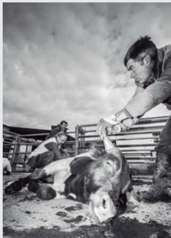
"Cirugía de Campo", de Alfonso Ferrer, resultó ganadora de la segunda edición del concurso de fotografía Veterinarios en Acción que convoca el Consejo Andaluz de Colegios de Veterinarios. El jurado reconoce en la intensidad, fuerza y originalidad con la que refleja en una fotografía en blanco y negro la intervención quirúrgica de un ternero de cebo en una explotación de Almodévar (Huesca) y las condiciones en las que tienen que trabajar los veterinarios de campo.

Al término del almuerzo se realizó el tradicional sorteo de regalos cedidos por AMA, Felixcan, MSC, Laboratorios Ecuphar, Profarvet y PSN, además de los aportados por el Colegio como un lector de microchip y fonendoscopios. El Colegio obsequió además a todos los asistentes con una taza rotulada con el logotipo de la corporación.